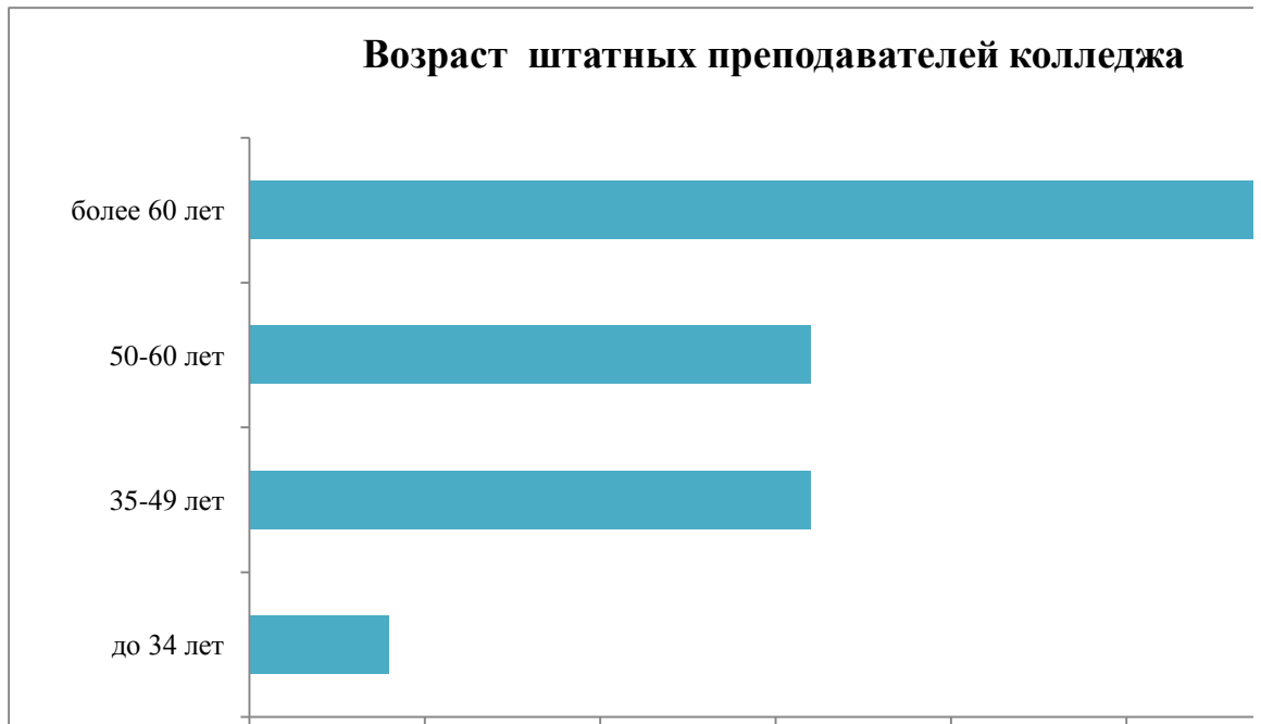
Рисунок 2. Возраст штатных преподавателей колледжа

В целях стимулирования творческих поисков преподавателей в области современных педагогических технологий; повышения мотивации к инновационной деятельности преподаватели колледжа регулярно принимают участие в городских, региональных, всероссийских, международных смотрах и конкурсах.